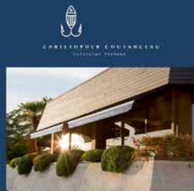
L'empreinte instantanée de l'Océan