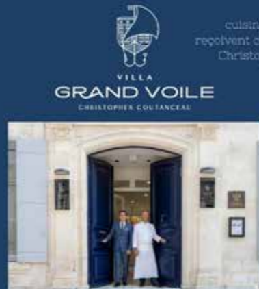
Écrin intimiste de plaisirs épicuriens

Plage de la Concurrence, 17000 La Rochelle contact@coutanceaularochelle.com 05 46 41 48 19 coutanceaularochelle.com