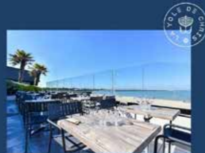
Convivialité et retour de pêche

11 rue de la Coche, 17000 La Rochelle contact@villagrandvoile.com 05 46 44 51 24 villagrandvoile.com