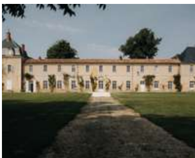
Abbaye de la Grâce-Dieu 17170 Benon